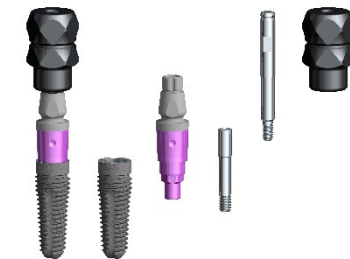
Abbildung 2: Bestandteile des vormontierten Implantates

Das LOBS Implantat (Abbildung 1) ist ein enossales Zahnimplantat mit Gewinde aus biokompatiblen Reintitan, Grade IV, mit säuregeätzter Oberfläche. Das Implantat wird vormontiert mit Eindrechkopf, Eindrehschaft und Handeindreher geliefert (Abbildung 2).